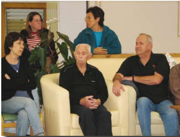
שפע פעילויות ושרשרת בין גילית.

אנשים מבחוץ, לרבות טיולים באזור ומחוצה לו וימי כיף לכל הקשישים. פעילות מיוחדת נרקמת יחד עם הגיל הרך, במיוחד לקראת החגים. לכל חג מוקדש בוקר מיוחד לפעילות משותפת לסבים ולנכדים בגבע, ולרוב מדובר בפעילויות מוצלחות ביותר. כל שבוע מגיעה גם בחורה העוסקת בטיפול בעזרת בעלי חיים, וגם כאן נרקם קשר מבורך בין שרשרת הגילאים, מבית תינוקות ועד לשיבה. השבוע, למשל, ארחנו רקדנית בטן נהדרת באווירה מאוד נעימה.