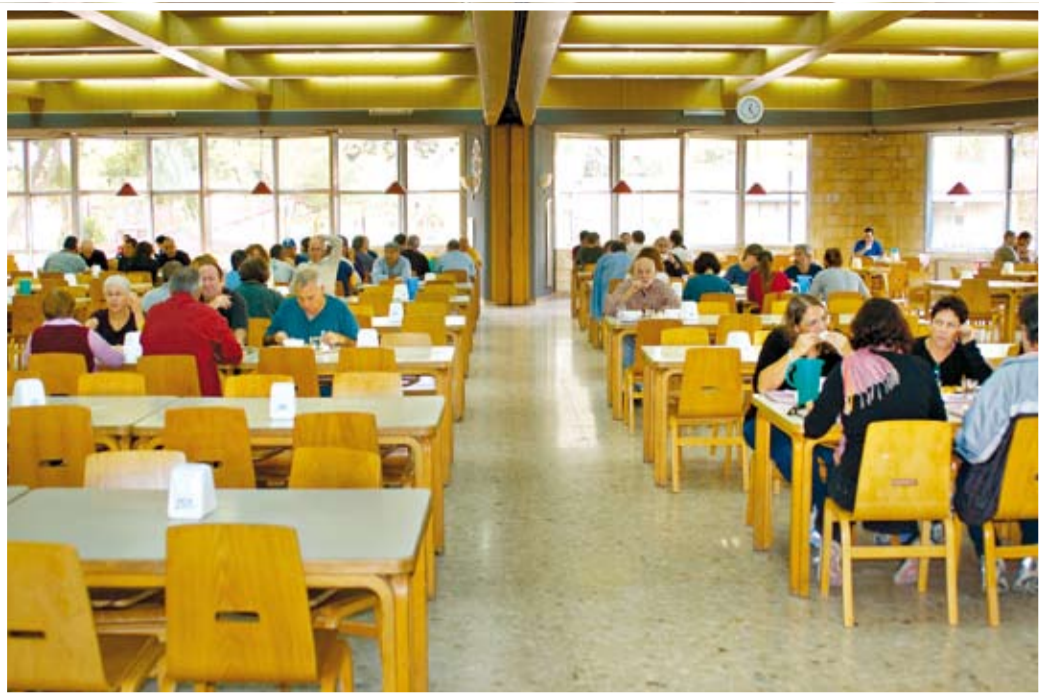
לראות חדר אוכל קיבוצי מתפקד בשבת בפול ווליום, בלי תקתוקי הקופה ובלי כרטיס אשראי