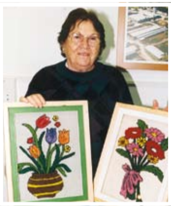
מרכז תעסוקה מעבר לקיר, מיצירות סביונית רבקה

אנשים מבחוץ, לרבות טיולים באזור ומחוצה לו וימי כיף לכל הקשישים. פעילות מיוחדת נרקמת יחד עם הגיל הרך, במיוחד לקראת החגים. לכל חג מוקדש בוקר מיוחד לפעילות משותפת לסבים ולנכדים בגבע, ולרוב מדובר בפעילויות מוצלחות ביותר. כל שבוע מגיעה גם בחורה העוסקת בטיפול בעזרת בעלי חיים, וגם כאן נרקם קשר מבורך בין שרשרת הגילאים, מבית תינוקות ועד לשיבה. השבוע, למשל, ארחנו רקדנית בטן נהדרת באווירה מאוד נעימה.