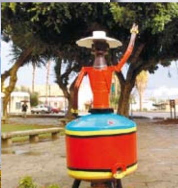
"כשמישהו צריך לשלוף קיבוץ, זה תמיד יהיה דגניה ב'

שם קיבוץ: דגניה ב' תאריך לידה: סוכות 1920. מספר חברים: קצת פחות מ-200. אוכלוסיה כללית: סביב 450. מספר כלבים: מי סופר? מספר חתולים: יותר מכל תושבי עמק הירדן... מקורות פרנסה מרכזיים: חקלאות, מפעל סיליקון, אירוח כפרי, השכרת דירות ושונות.