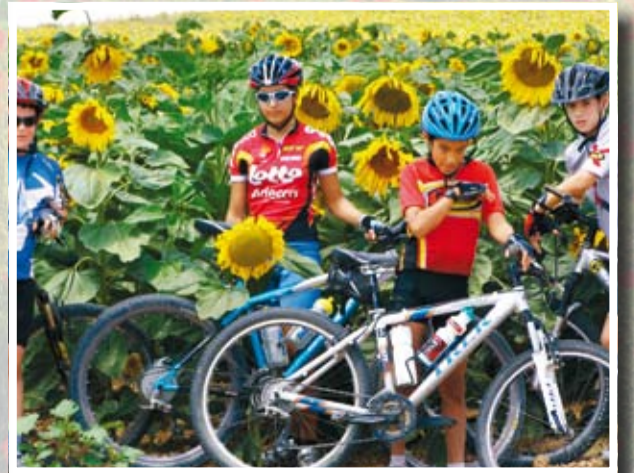
רכיבה אתגרית, ילדים בשדה החמניות

טוב שאפשר לעשות רגע לפני הרגע הסוריאליסטי ביותר: חייל עובר אורח שנעליו מלאות בוך נכנס בדלת הזכוכית של החנות ונעצר נפעם מול המראה השליו, הממוזג של החנות החדישה בתוך הכאוס, ומול עובדי דים עסוקים להפליא בספירת מלאי של סוף השנה. גם האזרחות דורשת את שלה. היא גם תנצח לבסוף, למרבה הפלא.