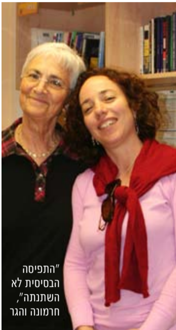
"התפיסה הבסיסית לא חרמונה והגר

דרך לא שגרתית לניהול המיטות לטפח את צמיחת