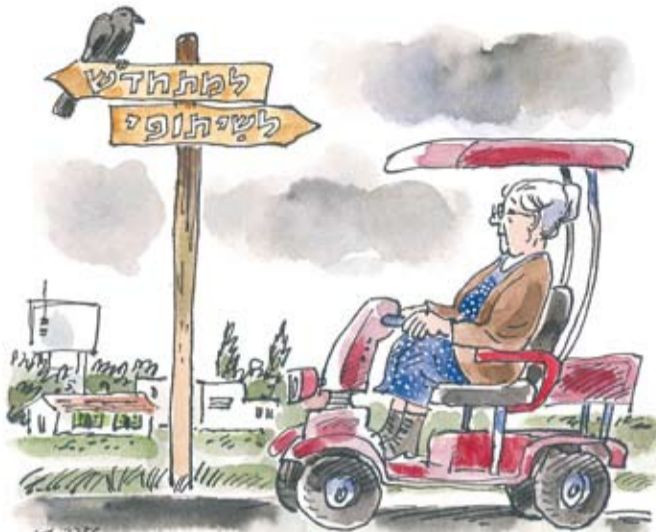
איור: יעקב גוטרמן / העוגן

אפשר לבחון את הדרך שעברה התנועה הקיבוצית על-פי יחסם של חבריה אל "המציאות": בעוד דור ההורים ביקש לתקן עולם וליצור מציאות חדשה, דור ההפרטה מתייחס אל המציאות כאל כוח טבע וגזירת גורל ומשכפל את חולייה