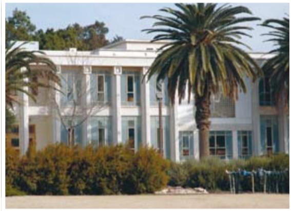
להחזיר עטרה ליושנה, בית הכנסת בקיבוץ לתרום יותר לחברה בישראל, תיבת נוח במשק הילדים

משהו פיקנטטי? חפשו בקיבוץ אחר. יבנה הוא קיבוץ רציני, הרואה את עצמו כקיבוץ הכי שיתופי בארץ. ב-6:15 בבוקר הם כבר שותים קפה בחדר האוכל, לאחר התפילה, ובין הנושאים על סדר היום עדיין מככבת גניבת השעונים הטראומטית מהמפעל המקומי