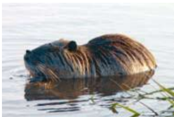
עלתה לארץ בשנות הארבעים. נוטרה באגמון החולה