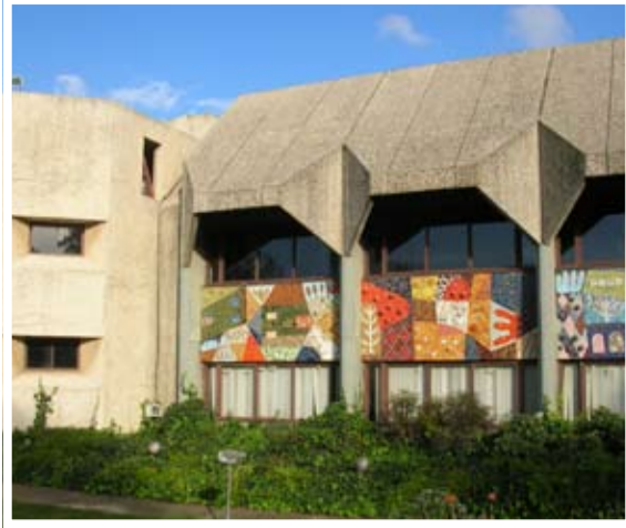
ארוחת בוקר עד 9:55, חדר האוכל של יבנה