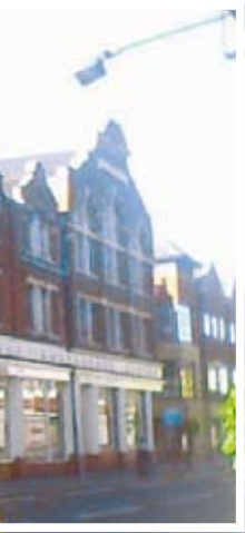
מרכז הקונגרסים של או