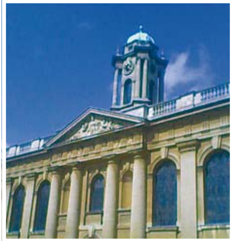
קווינס מראה הכניסה