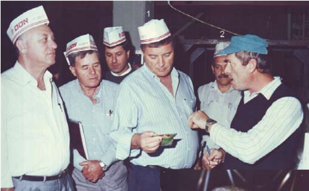
ידע להקשיב בלי גאווה והתנשאות, פלג עם פועלי "אוס"

היום, במציאות הכלכלית שהשתנתה כליל, עלינו לשוב ולבדוק האם דב'לה פלג, מזכיר הקבה"א בעבר שנפטר זה עתה, טעה או צדק בטענתו, שצבירת נכסים פנימית מקנה לחברים יותר ביטחון כלכלי וקיום בכבוד מאשר קרן פנסיה חיצונית