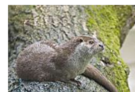
לוטרה, שחיינית נהדרת ומאוד חברתית

זו הזדמנות מצוינת להציג בפני הקוראים מהו ההבדל בין לוטרה לנוטרה. ראשית לכל, הלוטרה היא שלנו מימים ימימה, ואילו הנוטרה הובאה לארץ רק בשנות הארבעים, כשעוד הייתי ילד, לצורכי תעשיית הפרוות. אבל אז התברר, שכאן חם למדי ואין צורך לגדל פרוות, במיוחד כאשר התחילו לגדל את הנוטריות דווקא בעמק בית שאן. הנוטרה כמעט מתה מצחוק, ועוד שערות הפרווה נשרו לה. כך שחררו אותה ומאז יש לנו עוד יונק יפה בארץ.