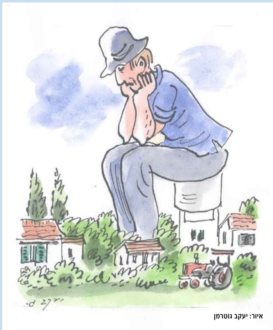
איור: יעקב גוטמן

האחריות לבחירה היא עלינו בלבד, כי מדובר בחיינו שלנו ולא בחייהם של אנשים אחרים.