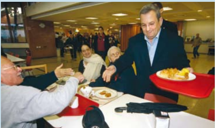
חברים וחבר בחדר האוכל של מעגן מיכאל

(15.1.67) אומר לנק: "עברתי ימים קשים, כי הרגו את בני. חשבתי שאש תגיע, זה היה בני יחיד. אבל האלוהים נתן לי עוד שני בנים. אושרי מאלוהים, כי גם אתכם הציל ממוות... אנח נז נמות, אבל נשאר זיכרונות טובים לילדינו..."