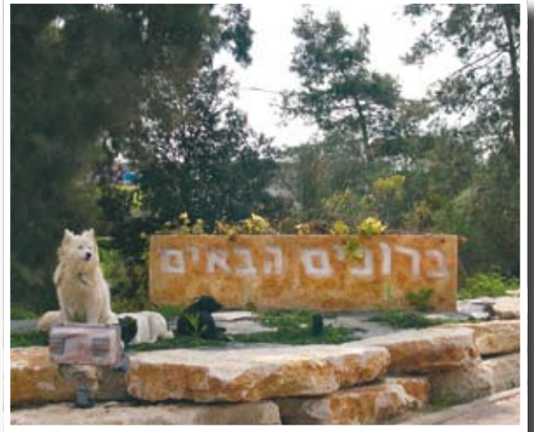
מזכירים תמיד את ר' יוחנן בן זכאי, הכניסה ליבנה