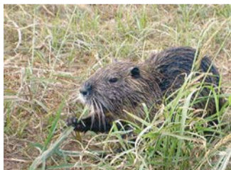
בסך הכל עכבר גדול, נוטרה הצילום מתוך ויקיפדיה

ויש עליה הרבה סיפורים. היא ניוונה מדגים ומזונות נוס"פים. חייבות לחיות רק במים באמת נקיים - דוגמת הפל"גים של הדן והחצבני.