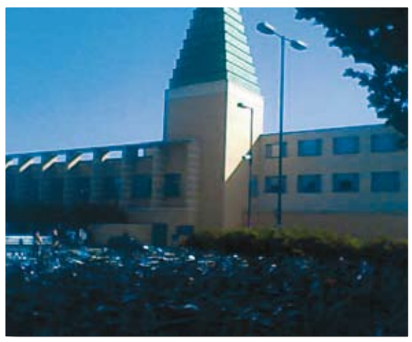
בית ספר למינהל עסקים על שם המיליונר הסורי וואפיק סעיד