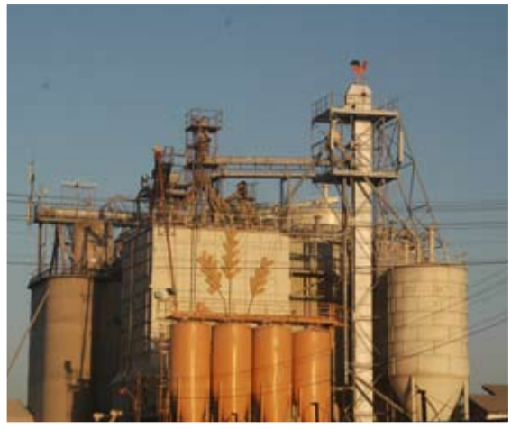
זוחסים את הכסף לשקים? מכון התערובת