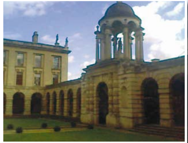
קווינס קולג' מבפנים