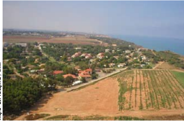
"אין בקיבוץ רעב, או חבר שאין לו אל מי לפנות", געש 2009

"רוב החברים שנשאו את דברם בכנס בבארי הם היוצרים את הניכור והפילוג עליהם דיברו והם המחלישים את החברה בכל קיבוץ שהחליט לעבור ל"שינוי ואורחות חיים חדשים". גם רב ניימן מגיב על הכנס בבארי