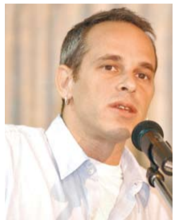
האם עברנו מסולידאריות של אחוות לוחמים ל"קייטנות רוחניות להעצמה אישית"? גדי טאוב