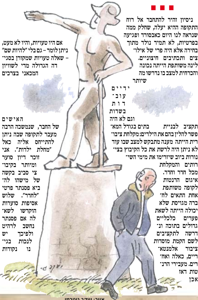
איור: יעקב גוטמן

ידיים עובדות בשדות וגם לא היה תקציב לבניית פשר להלין בהם את הילדים; מקלחת ציבורית הייתה מענה מתבקש למצב שבו עוד לא ניתן היה לרשת את כל הקיבוץ בציי נורות ביוב שיוזימו את מימי השי רותים והמקלחת מכל חדר וחדר. איגום הרנטות לקופה משותפת אחת התאים לח" ברה מגויסת שלא יכולה הייתה לשאת פערים כלכליים גדולים בתוכה ונ" דרשה לתקציבים לשם הקמת מוסדות ציבור אלמנטא" ריים, כאלה ואח" רים. מעבירי הרני טות דאו אכן