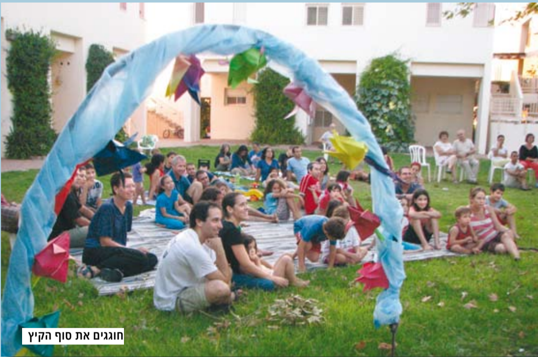
חוגגים את סוף הקיץ