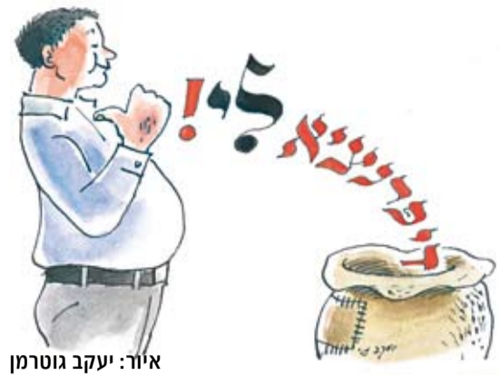
איור: יעקב גוטמן

בין חברי הקיבוץ. ערבות הדדית מלאה חשובה מאוד גם ל"דיפרנציאליים". 68% מהם, תומכים בה. הממצא הזה מעלה שאלה חשובה: האם "הדיפרנציאליים" מורעים לכך, שהערבות ההדדית המלאה עלולה להיפגע ע"י שכר דיפרנציאלי והפרטות עמוקות?