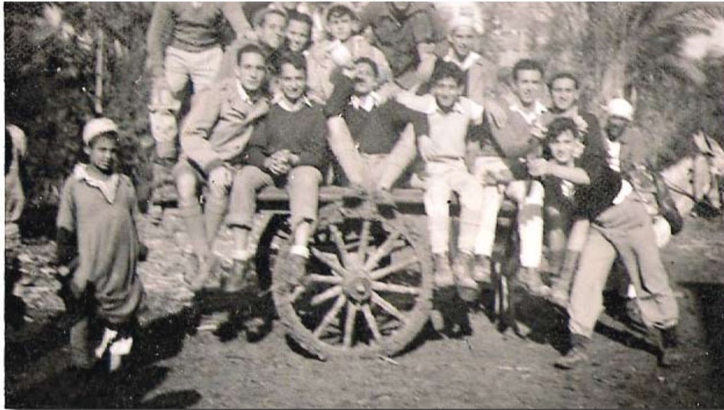
קיבוץ עין שמר, יוצאים לעבודה, 1948, מתוך האוסף של אבי אבולגון ז"ל

רבים שקצו היום ברעיון השיתופי נוהגים "למנף" טעויות של העבר. ניסיון להתחבר אל רוח התקופה בה פעל "הקיבוץ הישן" יעלה, שחלק ממה שנראה לנו היום כאבסורד, לא נולד מתוך בחירה, אלא היה פרי אילוצים ותכתיבים חיצוניים. מי יכול לדון באלה שחיו בימים אחרים, בסביבה שונה?