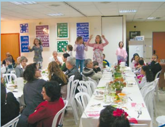
חדר אוכל אמנם לא קיים, ובכל זאת אוכלים ביחד

השכנים מהרחוב אומרים, שאנחנו קיבוצניקים. לצרעה אנחנו לא ממש נראים