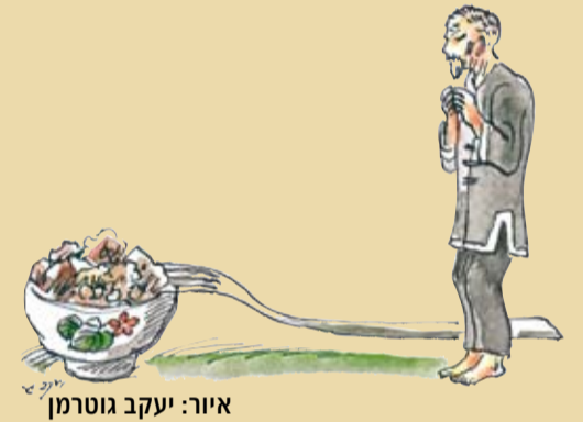
איור: יעקב גוטמן

אכל, נהנה והגיע למסקנה, שבמקום בו עוזרים אחד לשני נעים יותר לאכול והחיים יפים יותר.