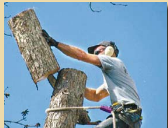
לכת על הראש המרגיש במקום על הרגליים המושכות אותנו למטה

כול אדם חווה קשיים, לעיתים אפילו טראומות קשות, חלקן גלויות וחד לקן סמויות מן העין. ההכרה, שגורל זה הוא נחלת כולנו, כול אחד מאתנו