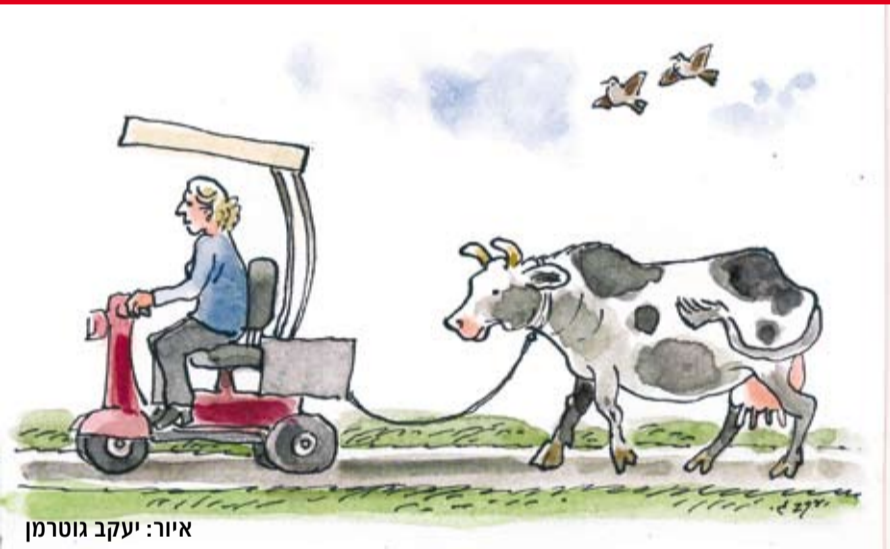
איור: יעקב גוטמן

ונסע לראות את 'מאנצ'סטר יונייטד' באנגליה ולא היה לו כסף כדי לחזור.