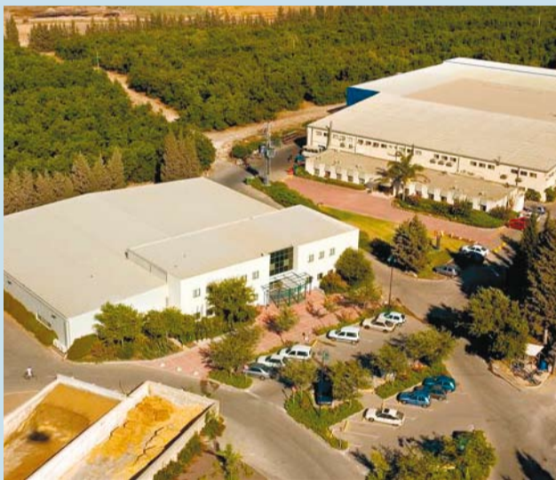
בניית איזון נכון בין צרכי הפרט והכלל צילומים ממפעלי קיבוץ עין-השופט

מצב זה יכול להיות כיום נחלת העבר. גם בהתחשב בעובדה, שחלק ניכר מהקיבוצים השיתופיים הם גם קיבוצים בעלי מצב כלכלי איתן ומצליח, וגם אם יודעים ומבינים שהתודעה הזו, של בניית איזון נכון יותר בין צרכי הפרט והכלל, – כבר חדרה ומשתרשת בלבבות ובע"שייה היומיומית וארוכת הטווח כאחד. על כן יאמר, שלא עוד זיהוי בין חיי שיתוף קיבוצי לבין דרישת הקרבה גדולה מהפרט, אלא ניצול היתרונות של היחד השיתופי גם להטבת חיי של החבר, של הפרט ושל משפחתו. אם בדרך זו ימשיכו וילכו – השמיים הם הגבול להתחזקות ולעלייתו של הקיבוץ השיתופי.